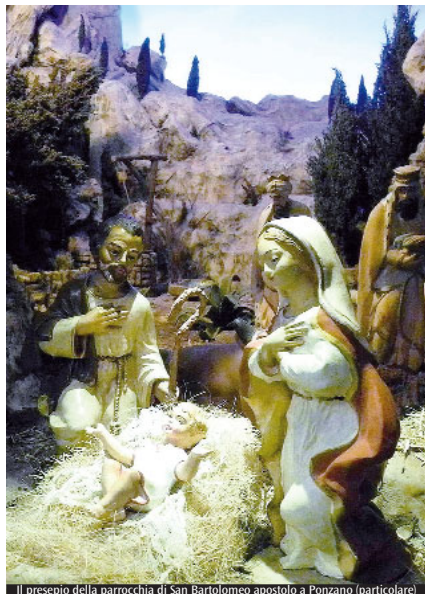
Il presepio della parrocchia di San Bartolomeo apostolo a Ponzano (particolare)