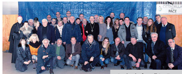
I giornalisti spezzini con il vescovo

L'omelia del vescovo e il dibattito tra i giornalisti hanno sottolineato l'importanza e la responsabilità del ruolo di chi fa informazione