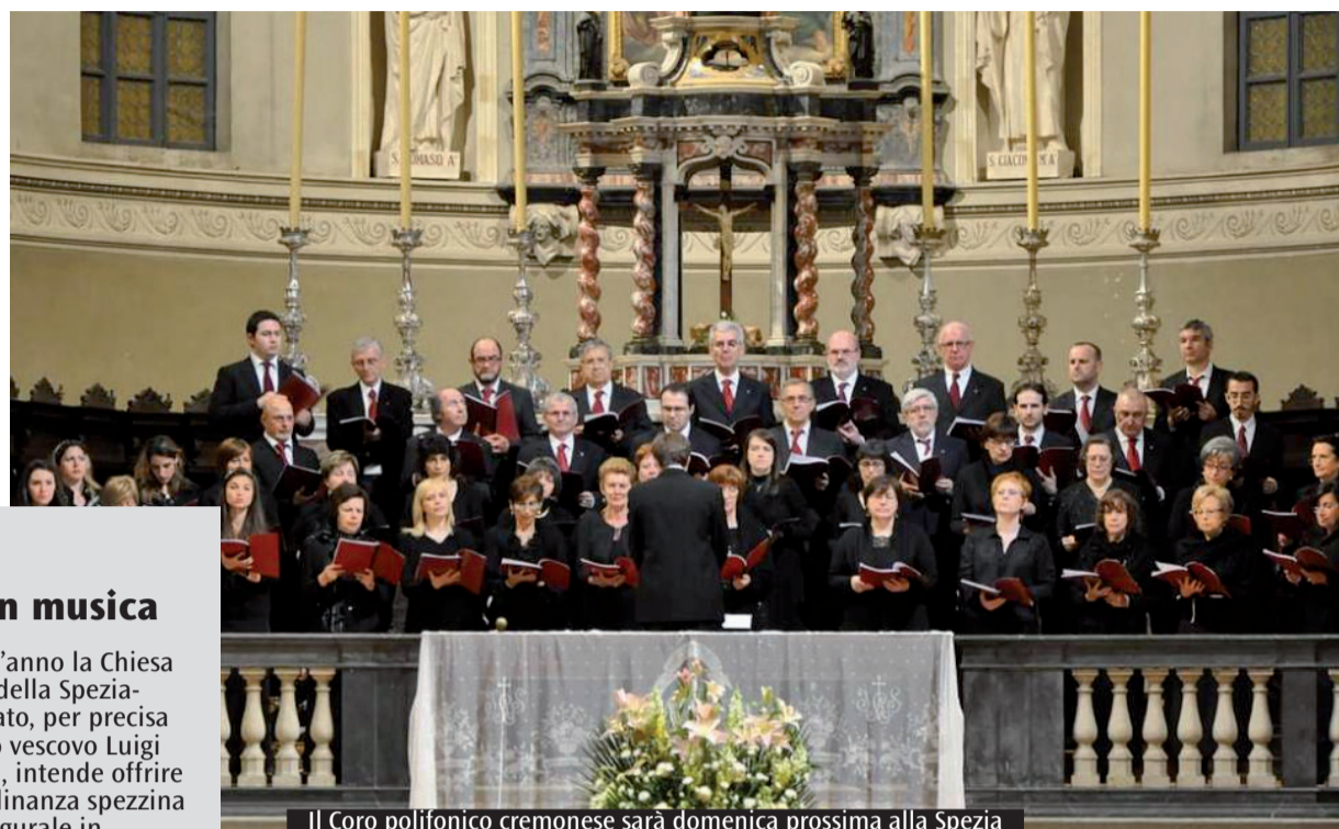
Il Coro polifonico cremonese sarà domenica prossima alla Spezia